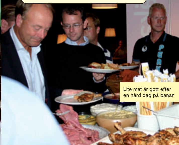
Lite mat är gott efter en hård dag på banan