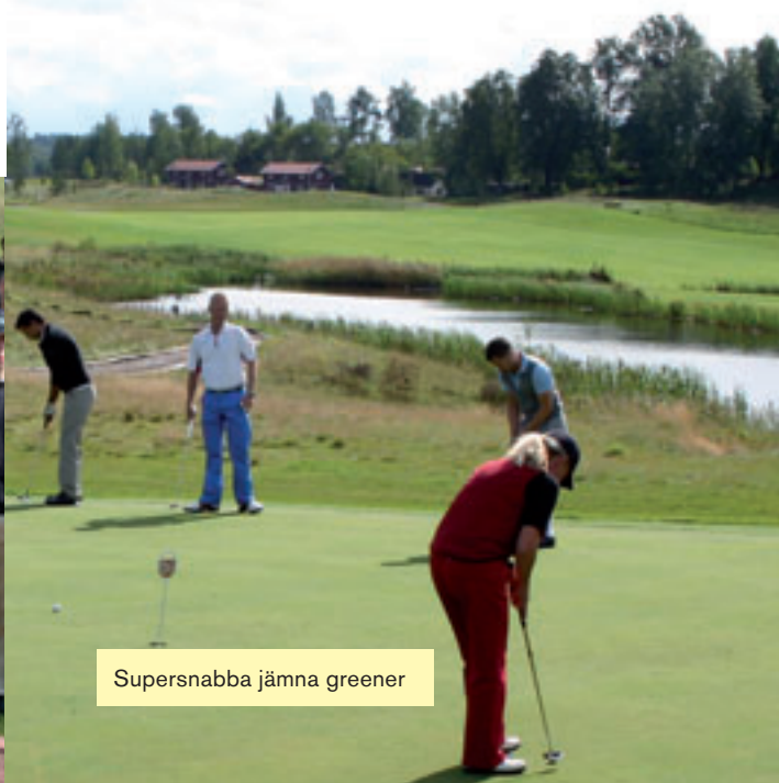
Supersnabba jämna greener