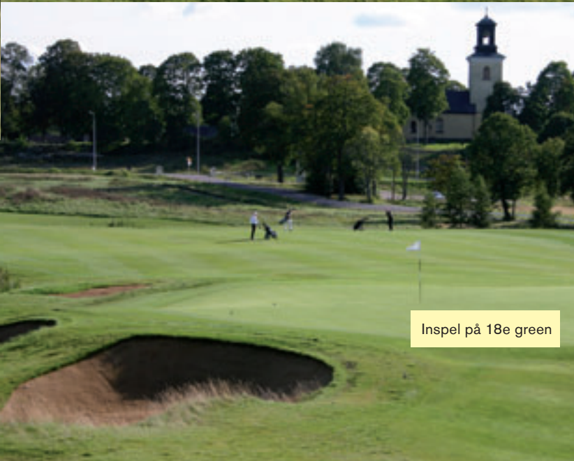
Inspel på 18e green